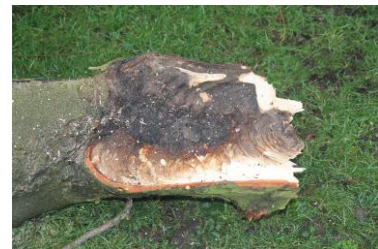
Kastanjabloedingsziekte in de kastanjes langs de Lijnbaan

Nu in de 21 e eeuw staan bomen, die in de late 19 e eeuwse landschapstuinen en parken geplant werden, na ruim honderd jaar volwassen groot, breed en dicht op elkaar. Er is veel onderlinge concurrentie in de boomkronen, de schaduw domineert. Er is ook veel sterfte. Verjonging van het bomenbestand blijft uit omdat het in de onderliggende bodemlaag aan licht ontbreekt. Hierdoor krijgen zaailingen geen kans om uit te groeien tot toekomstboom. De struiklaag, nodig om een zichtlijn te sturen en om vogels en insecten van voedsel te voorzien, wordt eveneens door lichtgebrek langzaam uitgehold. Daarnaast zijn er problemen met lanen. Deze komen door ouderdom of boomziekten, zoals de kastanjabloedingsziekte, essentaksterfte of iepziekte, in de aftakelingsfase; sterven langzaam af, en worden windgevaarlijk. Door uitval van individuen wordt de laan dan steeds minder herkenbaar als laan. Wanneer er, als vervanging, jonge bomen naast de oudere bomen worden geplant krijgen deze geen kans omdat de oudere bomen domineren. De jonge boom blijft in leven maar groeit niet verder, het laanbeeld blijft onduidelijk. Het is dan beter de laan in zijn geheel te kappen en te vernieuwen, een investering voor generaties na ons.